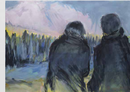
Landschaft | Landschaftsbetrachter | 2022