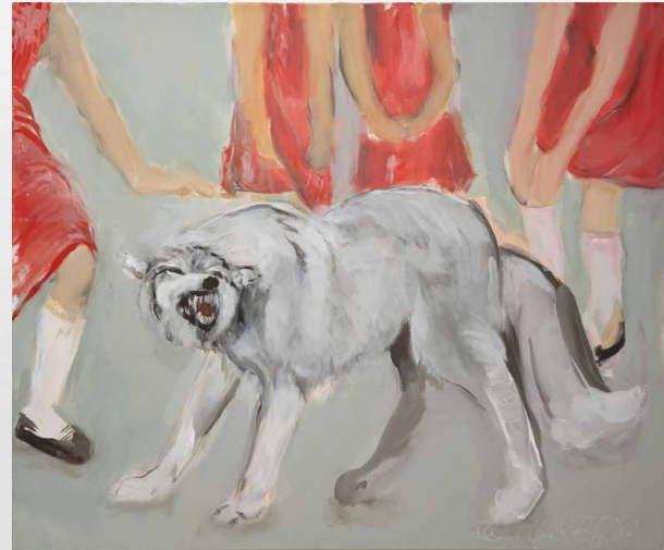
Rotkäppchen will den Wolf zähmen | 2015